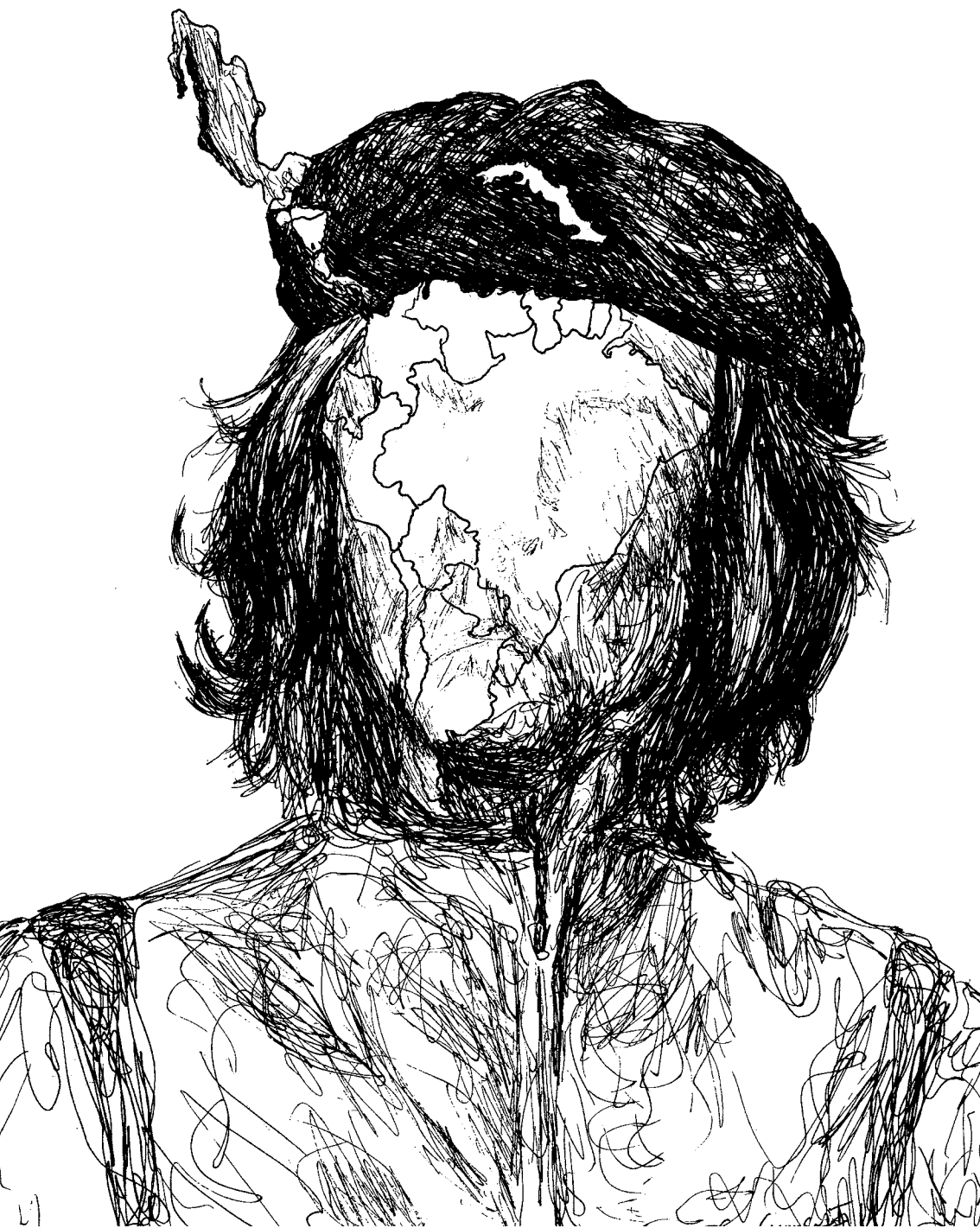
La presencia del Che en América Latina